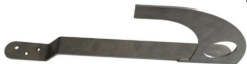
SIHA MAX BS

Crochets de sécurité selon EN 517: 2006 type B. Tous sens de charge.