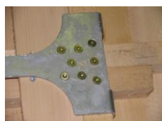
DBS 09, Montage